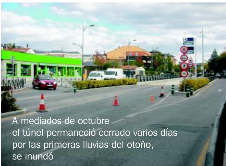
A mediados de octubre el túnel permaneció cerrado varios días por las primeras lluvias del otoño, se inundó

Este túnel aparcamiento será la pesada herencia que nos dejará este alcalde y su equipo de gobierno a todos los ciudadanos de Collado Villalba.